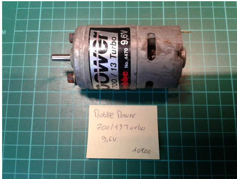
Moteur type speed 700 turbo 9,6v