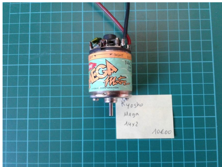
Moteur kyosho mega 14/2